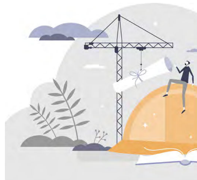
ILLUSTRATION DE SITUATIONS

Chacun doit s'engager à employer le dispositif de recueil des signalements pour dénoncer toute situation contraire aux règles du présent code éthique.